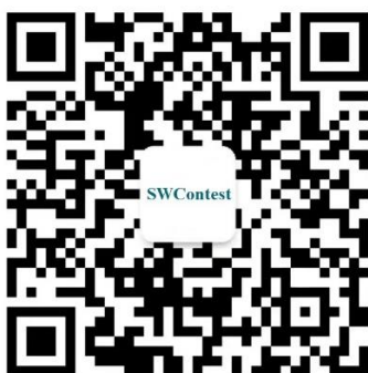
图1 大赛微信公众号

2024年10月18日10:00至2025年1月3日18:00，以学校为单位组队，每位参赛者限加入一支团队。大赛通知也将同步在微信公众号发布（可扫描图1中二维码关注赛事微信公众号SWContest），大赛官网交流群：792394347。